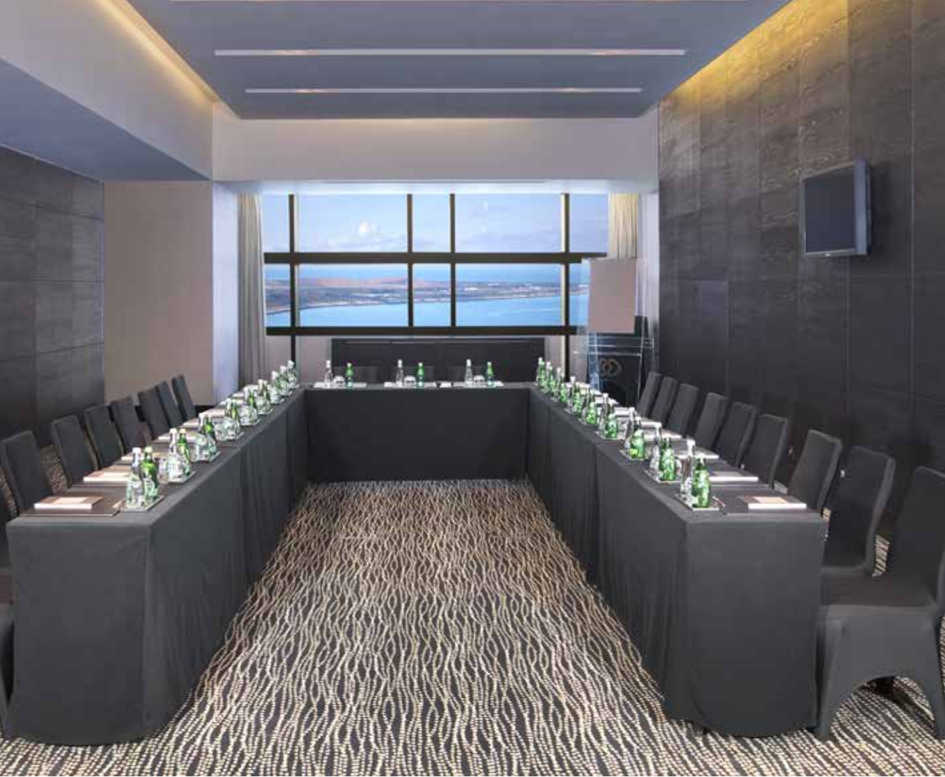
Turquoise meeting room